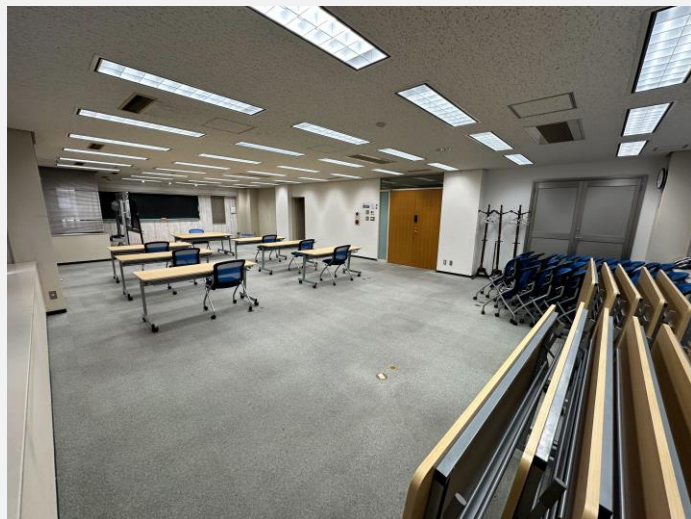
後方から撮影した写真例